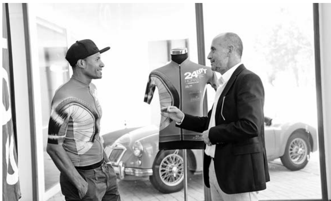
Evento é organizado pela Associação Amigos do Pedal

“Aos ingredientes de sempre - a melhor organização, o melhor percurso, o melhor desafio, a