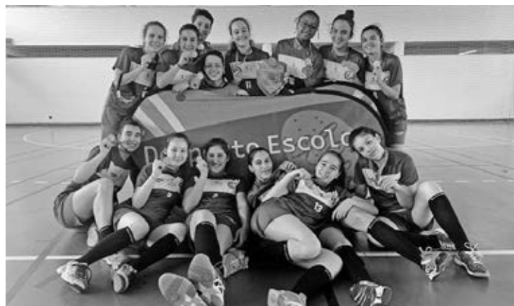
Equipa feminina de andebol do Agrupamento de Escolas de Celorico de Basto