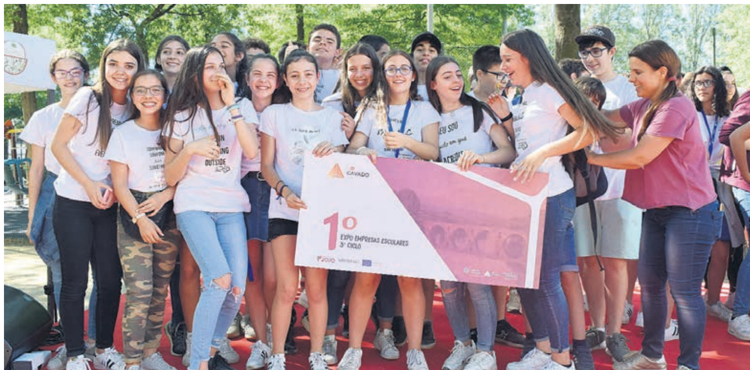
Alunos da Escola Básica de Lamações venceram o concurso com projecto 'Smart UP'