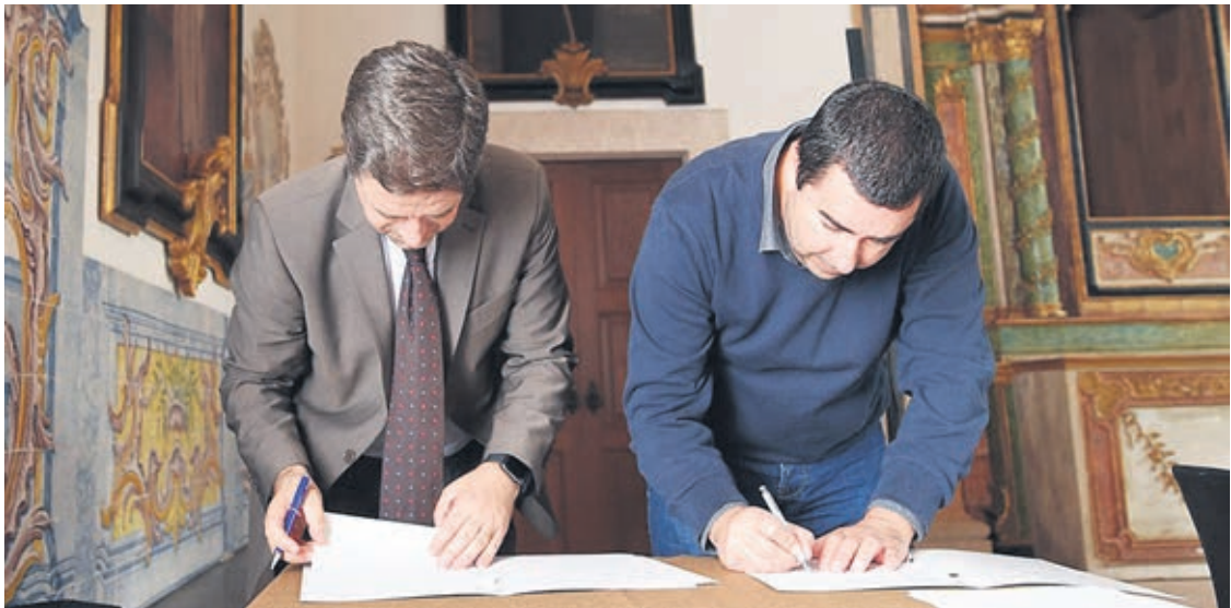
Município de Braga e Quercus celebraram protocolo durante o Greenfest, que decorre até amanhã no Mosteiro de Tibães

Este é um projecto que será realizado em colaboração com a Quercus, a associação ambientalista com a qual o município assinou um protocolo de colaboração técnica. A assinatura do protocolo teve lugar no Mosteiro de S. Martinho de Tibães, onde decorre, até amanhã, o GreenFest, o maior evento de sustentabilidade em Portugal.