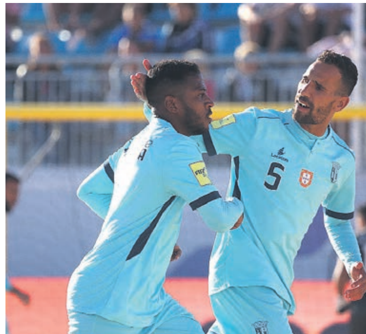
FACEBOOK NAZARE BEACH EVENTS

O jogo está agendado para perto das 19 horas, no Estádio do Viveiro, na Nazaré.