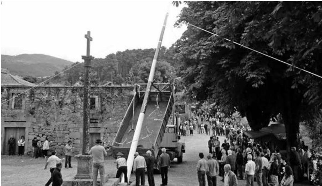
Levantamento do Pau cumpre-se amanhã na freguesia de Longos Vales, em Monção

O pau, um eucalipto, é escolhido pela ‘quadra’ que percorre os montes da aldeia. Uma vez cortado, é pintado às cores para ser “levantado” com a ajuda de quatro cordas entrelaçadas. E uma vez levantado, é enterrado para