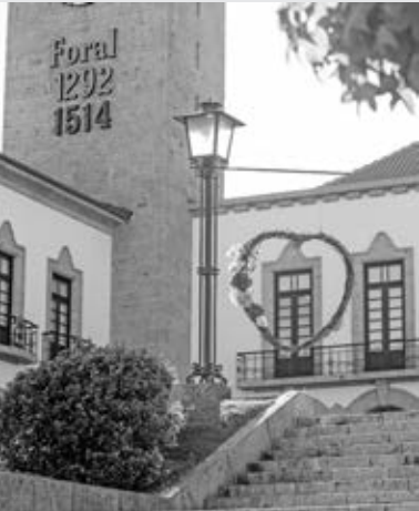
Há 12 cenários para tirar fotografias

Está a decorrer até ao dia 30 de Junho o passatempo de fotografia ‘Póvoa em Flor’, que a câmara municipal está a promover. Estão disponibilizados 12 diversos cenários florais, instalados em espaços patrimoniais do concelho, junto dos quais as pessoas participantes devem tirar fotografias. Cada pessoa tem que participar com o mínimo de sete fotografias e o máximo de dez fotografias. As fotografias têm que ser publicadas no evento do Facebook Póvoa em Flor, através da criação de um álbum com a descrição #povoamflor. O álbum que obtiver o maior número de Gostos (Likes), até às 23.59 horas do próximo dia 30, será o vencedor. Os resultados serão divulgados na página do Facebook do município da Póvoa de Lanhoso, no Facebook do Castelo de Lanhoso e em www.povoadelanhoso.pt , no dia 5 de Julho.