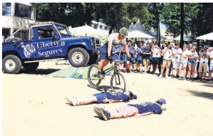
Expo Empresas Escolares decorreu no Parque Municipal de Barcelos

Este projecto permite que os alunos adquiram competências empresariais e empreendedoras, bem como de aspectos importantes para o trabalho e a vida, tais como a gestão ou controlo de alguma incerteza ou baixa auto-estima. "Estou certa de que o desenvolvimento destes programas no ensino básico e secundário é de grande ajuda no desenvolvimento da capacidade empreendedora dos nossos jovens", conclui a vereadora da Educação da Câmara Municipal de Braga.