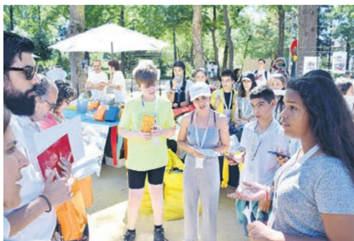
Escolas apresentaram projectos empreendedores